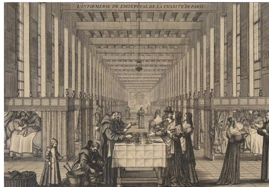
Document 7 - L'infirmerie de l'Hôpital de la Charité vers 1639 (gravure par Abraham Bosse).

Deux hivers froids successifs réduisent fortement les récoltes de blé. Devenu rare, son prix augmente.