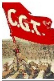
Création de la CGT 1895