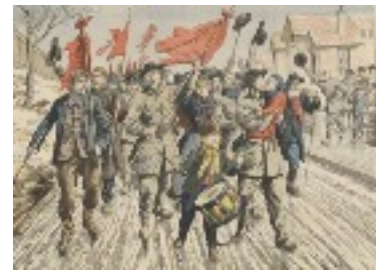
Droit de grève autorisé (si non-violence) 1864