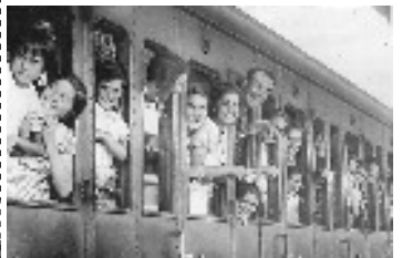
Lois sociales (congés payés, 40h/sem.) 11/06/1936