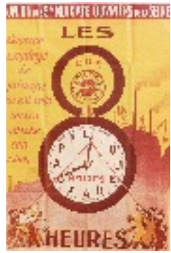
Journée de travail de 8h 1919