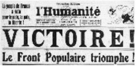
Victoire du Front Populaire aux Législatives = grèves de la joie 03/05/1936