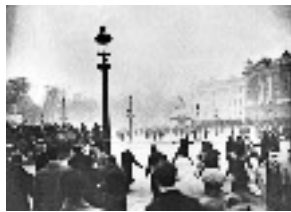
Manif. d'extrême-droite qui dégénère 06/02/1934