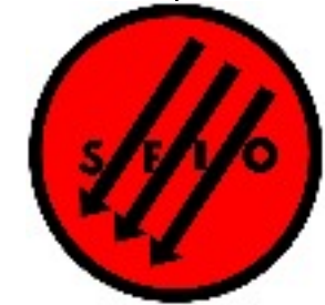
Création de la SFIO (parti politique ouvrier / Jean Jaures) 1905