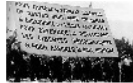
Manif. de la gauche française : alliance PCF + SFIO + Radicaux (= F.P.) 14/07/1935